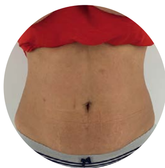
Lokalizált zsírtöbblet és bőrmegnyúlás Diana Hvas M.D. jóvoltából Rodovre, Dánia